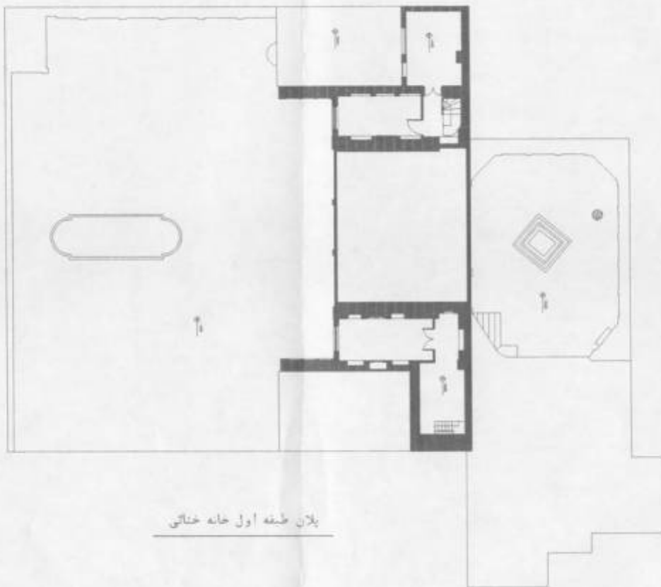
پلان طبقه اول خانه ختائی