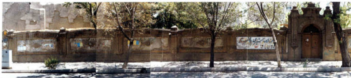
نمای عمومی از سردر و درهٔ تعلیم خواجه ابراهیم خلیل - شیراز