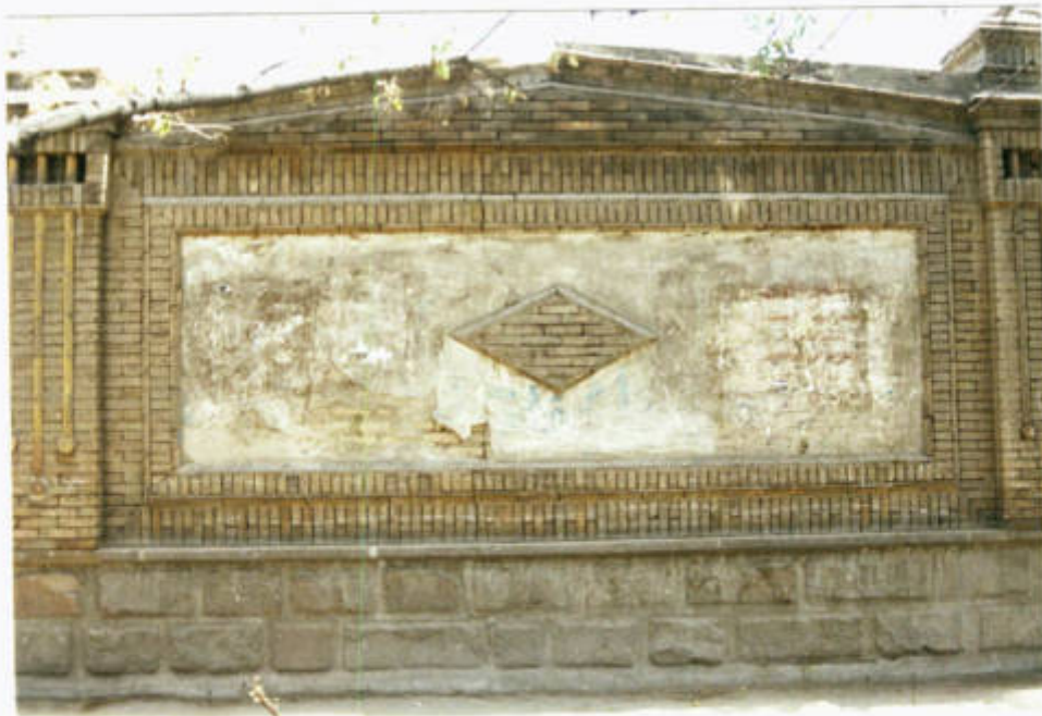
آجرکاری و قاب بندی بدنه