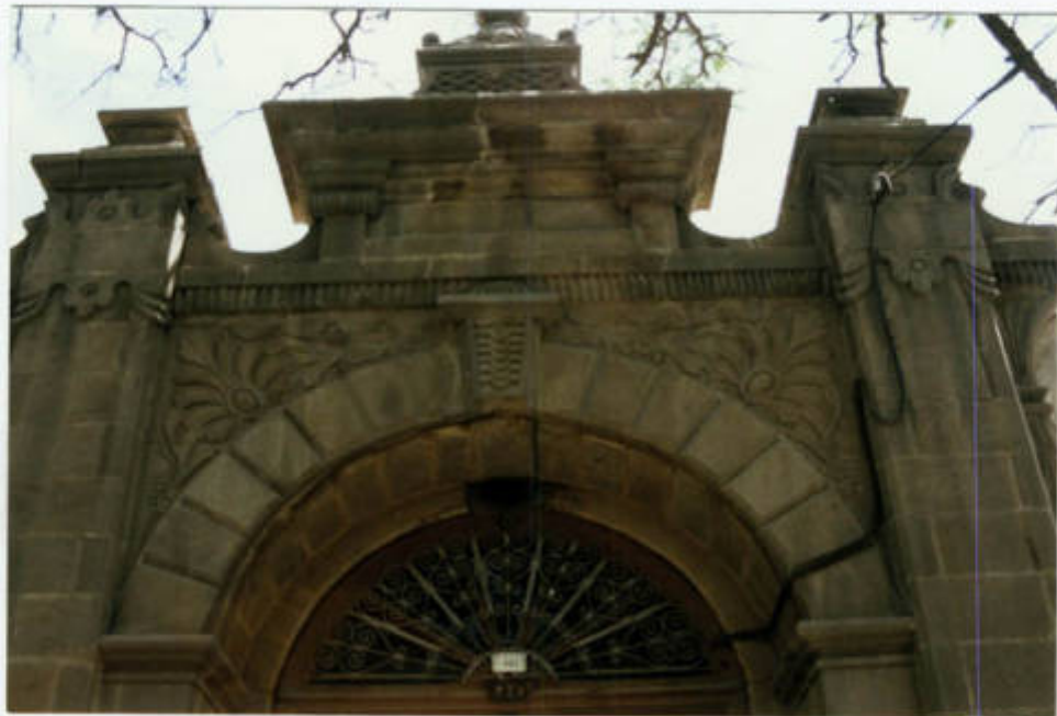
نمایی از جزئیات سردرب