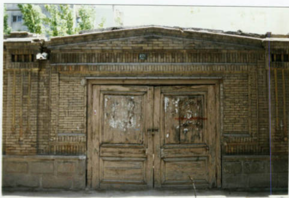
یکی از قباب بزرگ‌های تبریز